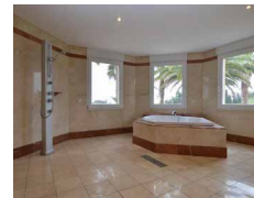
Marmor Dusche Bath room 大理石 シャワー バスルーム