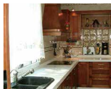
Kitchen システムキッチン