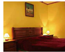
4 Double room 4x ダブルルーム