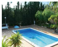
Private pool プライベートプール