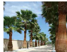
Car entrance +3 parking spaces 車専用入口 3台駐車可能