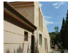
Way to BBQ グリルのある裏庭