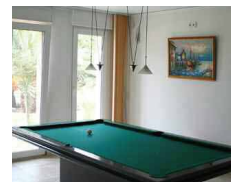
Billiard room ビリヤードルーム